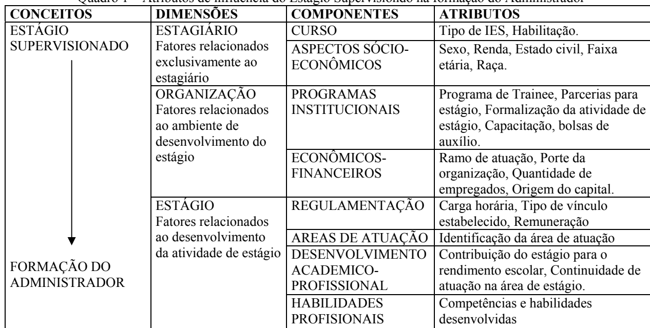
Quadro 1 – Atributos de influência do Estágio Supervisionado na formação do Administrador

Além disso, a partir da legislação vigente e da própria natureza social e econômica da atividade de Estágio Supervisionado, sugere-se no presente trabalho um conjunto de atributos que estariam intimamente ligados à prática e aproveitamento desta disciplina. Os atributos foram construídos a partir das dimensões de análise, buscando-se aspectos relacionados às variáveis sócio-econômicas, às variáveis relativas às habilidades profissionais e às variáveis relativas à área de atuação do administrador. Os atributos observados na pesquisa são apresentados no Quadro 1.