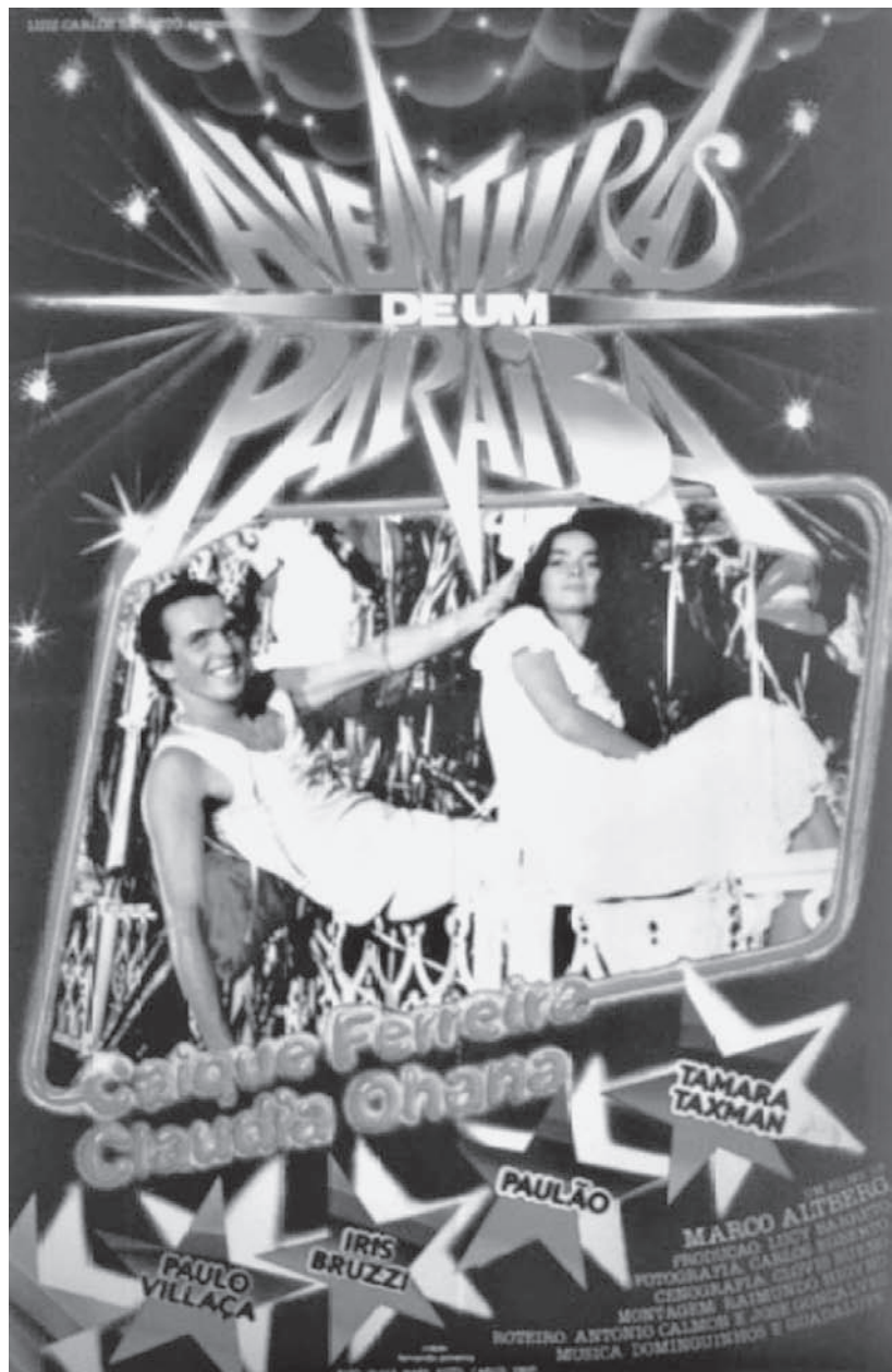
Cartaz de Aventuras de um Paraíba