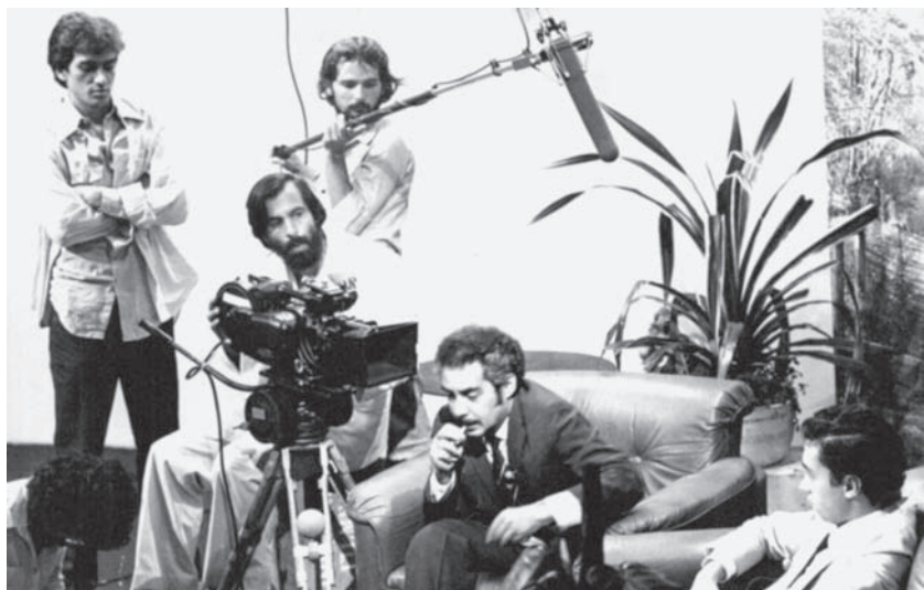
Filmagens de Prova de Fogo com Lauro Escorel, Flávio São Thiago e Pedro Paulo Rangel