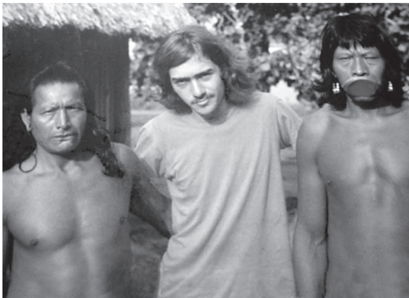
Com Raoní no Xingu