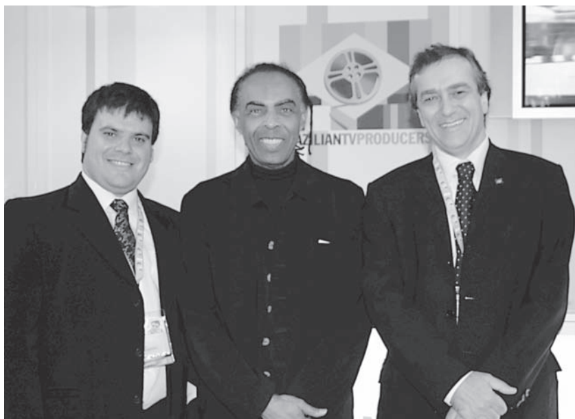
Com Gilberto Gil e Fernando Dias, em Cannes

Outro aspecto importante é o alinhamento astral entre as esferas federal, estadual e municipal do Rio de Janeiro quanto à produção audiovisual carioca, que perdeu muito espaço para outras cidades nos últimos tempos.