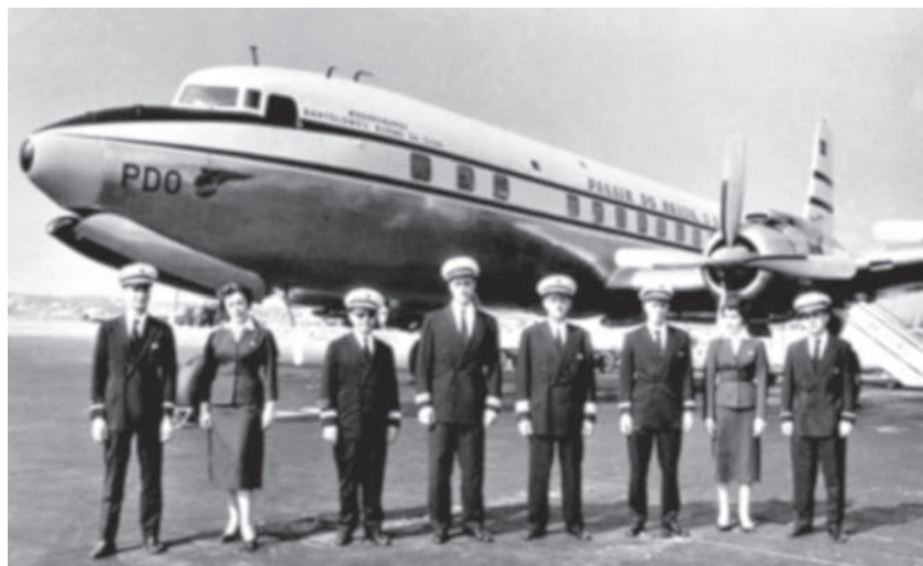
Panair do Brasil