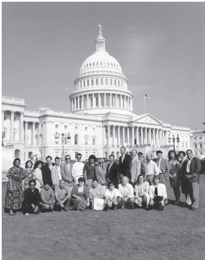
No Capitólio, em Washington, durante viagem pelos Estados Unidos