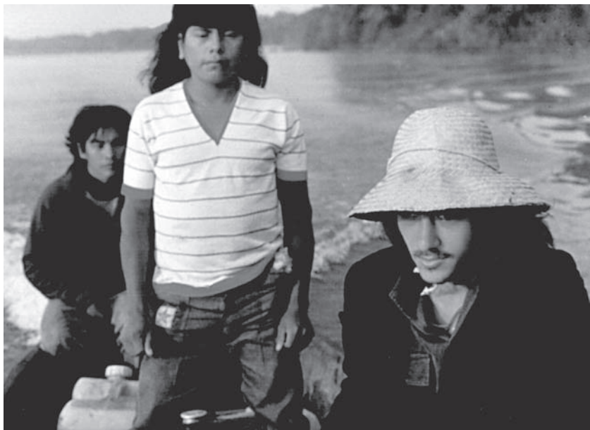
Durante viagem ao Xingu