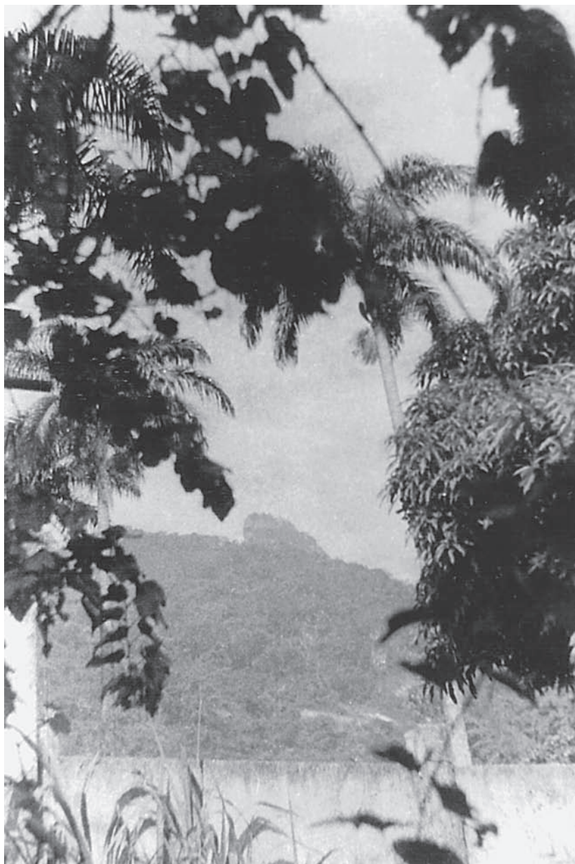
Vista da casa da ladeira da Ascurra